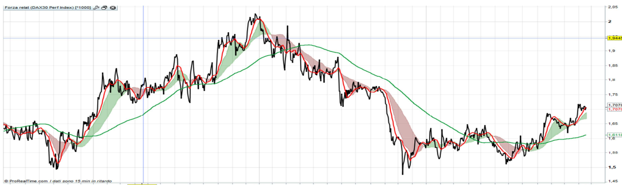
FORZA COMPARATIVA CON DAX

CONTINENTAL: L'azienda è stata fondata nel 1871 e si occupava della produzione di gomme per ruote di biciclette e carri. Tutti noi conosciamo Continental per i pneumatici, che fra le altre cose