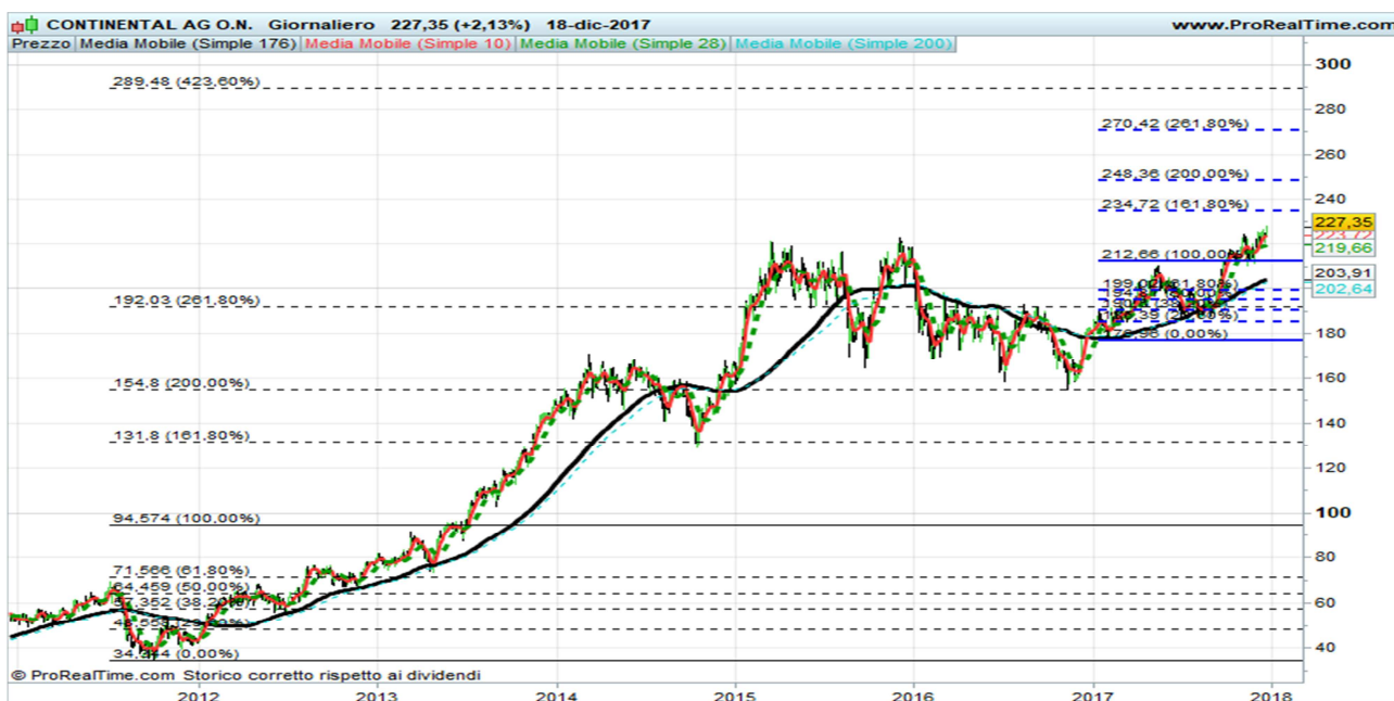
CONTINENTAL GRAFICO DAILY